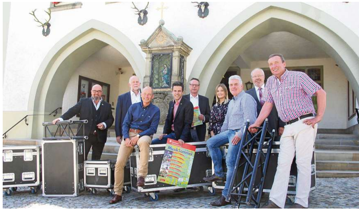
Das bunte Programm für den Musiksommer in Brilon steht. Im nächsten Monat stehen wieder viele Musiker in Brilon bereit und unterhalten das Publikum.