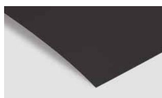
Stratifiés PerfectSense Topmatt