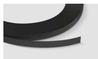
Bandes de chants PerfectSense Matt (ABS / PMMA)