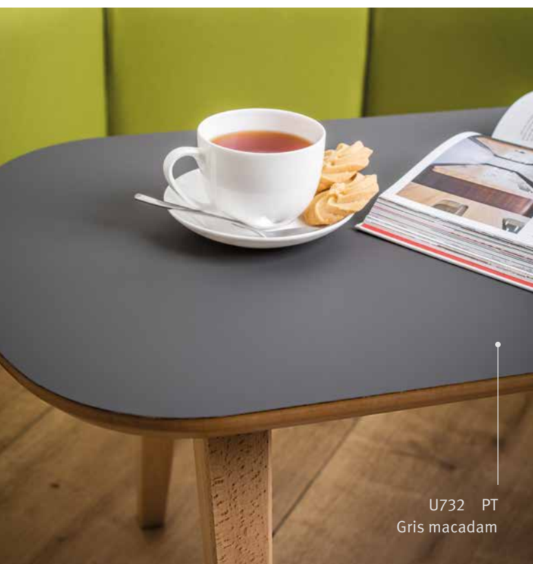
U732 PT Gris macadam

Le stratifié PerfectSense Topmatt est la dernière innovation des solutions décoratives haut de gamme PerfectSense.