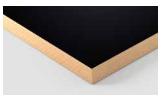
Panneaux laqués PerfectSense Matt