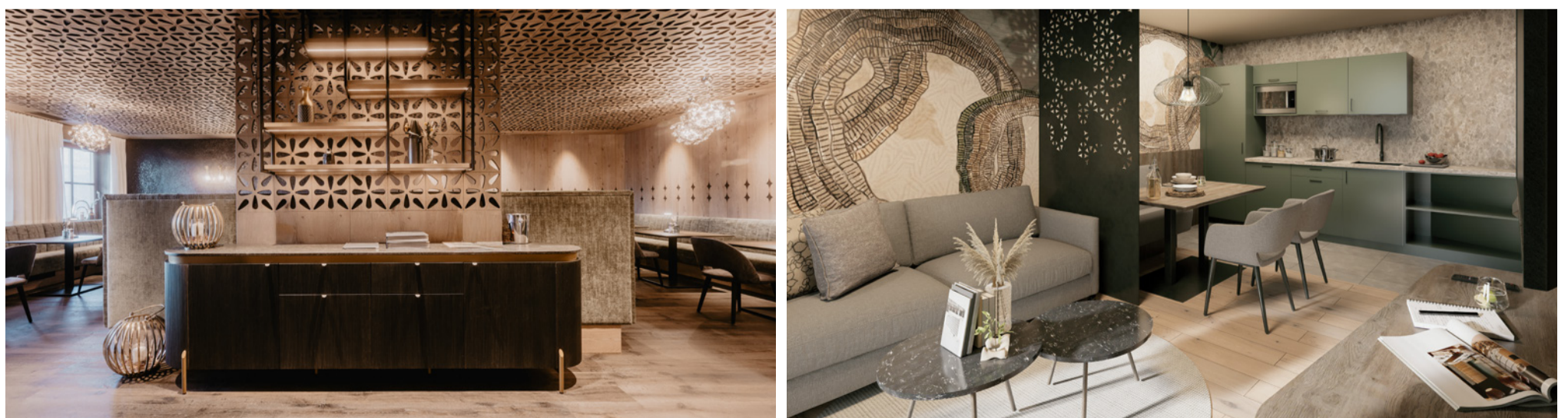
Hotelräume gestalten, die wirken und auf den ersten Eindruck begeistern, ist das erklärte Ziel der Mitarbeiter von köck + bachler. Ihre Hotelkonzepte sind eine Symbiose aus Erfahrung, Beobachtungen, Intuition und Kommunikation.

Auch das Netzwerk EGGER innovativ ist Teil dieser Zusammenarbeit. „Im Design ist es entscheidend, Entwicklungen früh zu erkennen. EGGER innovativ bietet Zugang zu neuen Materialien und Denkansätzen und unterstützt uns dabei, zeitgemäße Lösungen zu entwickeln.“ Für die kommenden Jahre wünschen sich köck + bachler die Fortsetzung der vertrauten Partnerschaft. „Wir freuen uns weiterhin auf die bewährte Zusammenarbeit – gerade im regionalen Kontext sehen wir großes Potenzial für gemeinsame Entwicklungen.“ Damit bleibt das Innenarchitekturbüro seinem Grundprinzip treu: Räume zu schaffen, die Geschichten erzählen – und Hotels, die in ihrer Entwicklung genauso lebendig bleiben wie die Menschen, die sie führen. ■