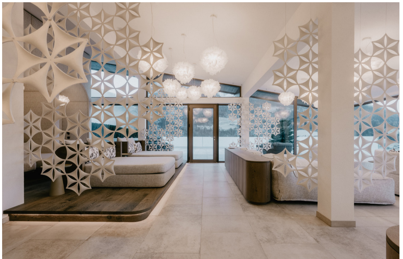
Das Innenarchitekturbüro köck + bachler steht für Hotelwelten im Alpenraum, die Atmosphäre und Substanz ausstrahlen, stets geleitet von einem klaren Designkonzept.

Seit mehr als zwei Jahrzehnten gestalten die Mitarbeiter des Innenarchitekturbüros köck + bachler charakterstarke Hotelwelten im Alpenraum. Der gemeinsame Weg der Geschäftsführer begann mit der Leidenschaft für Innenarchitektur und dem Wunsch, Räume zu gestalten, die Atmosphäre schaffen und funktional überzeugen. Bis heute hat sich köck + bachler zu einem etablierten Studio entwickelt, das Hotels nicht nur einrichtet, sondern maßgeblich weiterentwickelt.