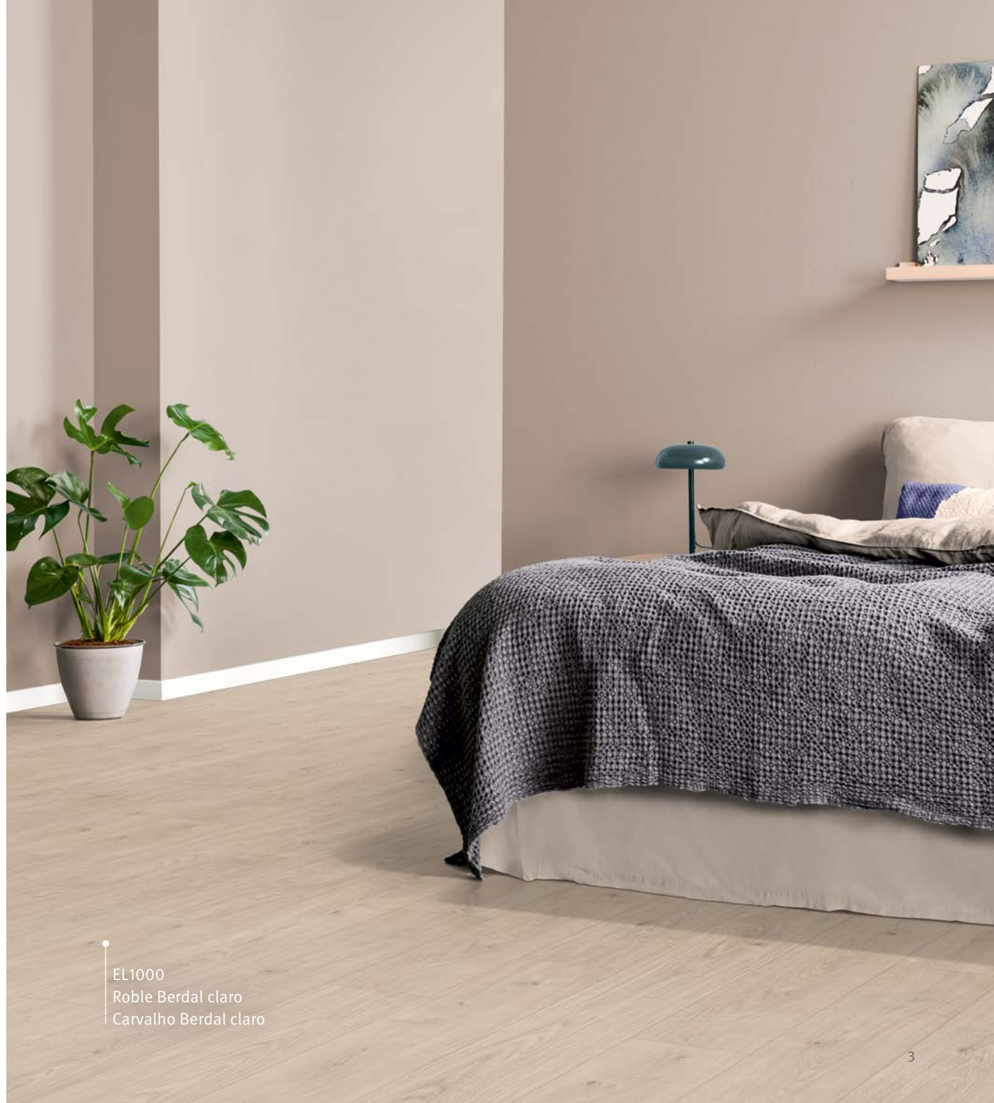
EL1000 Roble Berdal claro Carvalho Berdal claro

A espessura da prancha de 7 mm não é apenas um recurso-amigável, mas pode igualmente ser instalado sobre pavimentos de azulejos já existentes, tornando-se o produto de eleição para reformas.